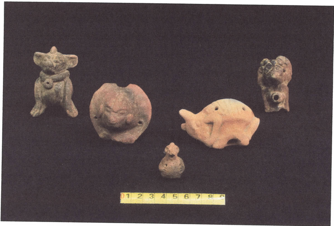
Figura 3. Artefactos sonoros que representan mamíferos.

pensar que la música formó parte de la ritualidad de los pueblos y que tenía un carácter simbólico en distintas actividades públicas y privadas.