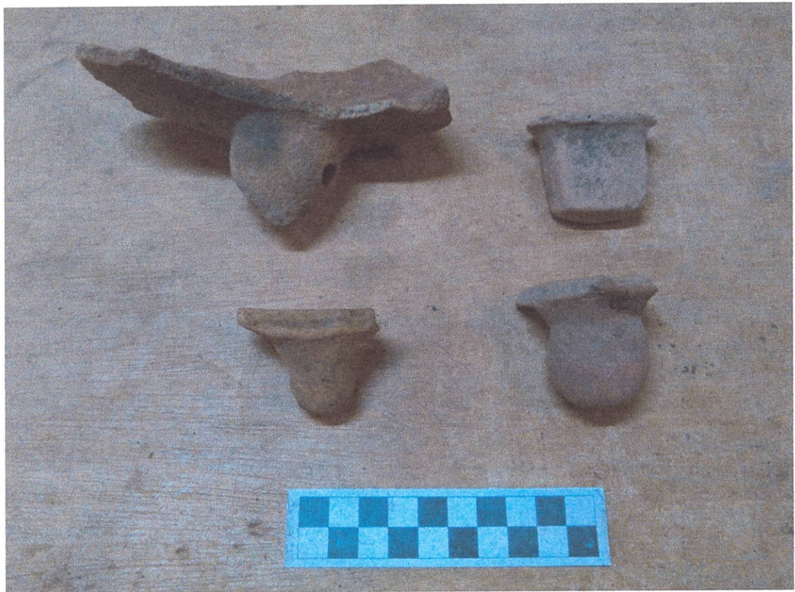
Figura 1. Cerámicas de la Fase Castillo.

Granada, todos de engobe rojo, una vajilla que se presenta en esta fase es la vajilla Ixtán, la cual muestra gran cantidad de pómez, la mayoría de formas de este tipo son cuencos de labios redondos con paredes y bordes convergentes. En la Fase Alejos el muestrario de la cerámica presenta gran cantidad de formas, como cuencos de paredes rectas y curvas de bordes rectos y en su mayoría evertidos, continúan las pestañas proximales, mediales y basales, las pastas van de un café rojo y anaranjado y continúan los soportes mamiformes, planos y de botón. En la Fase Castillo la cerámica no presenta grandes cambios, pero un rasgo diagnóstico para esta fase es el vaso cilíndrico trípode con soportes rectangulares, siguen algunas formas de las fases anteriores y en la vajilla "Negro Castillo" se presentan soportes de botón, pero también los hay redondos, mamiformes, y rectangulares, para esta fase continúan las vajillas utilitarias Rocrís y Ropom.